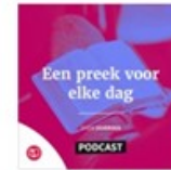
Een preek voor elke dag Geeloofstoerusting