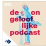
De Ongelooflijke Podcast NPO Radio 1 / EO