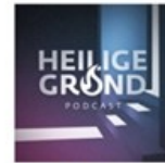
Heilige Grond PTHU & TUU