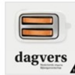
dagvers Nederlands-Vlaams B...