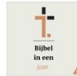
Bijbel in een jaar Nederlands-Vlaams B...