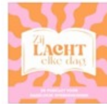
Zij Lacht Elke Dag Nederlands - Vlaams ...